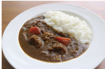
NEW 慶友特製ビーフカレー 【サラダ、スープ付き】

厳選した牛バラ肉を、3時間かけて丁寧に煮込み、 慶友オリジナルのカレールーで仕上げました。 青梅慶友病院で大人気のカレーです。 是非一度、ご賞味ください