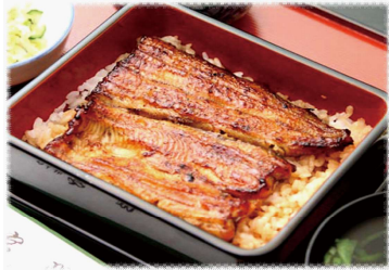
日本橋宮川のうな重 (吸い物・漬物付) 5,800円 (ハーフサイズ 3,000円)