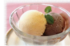
アイスクリーム 400円