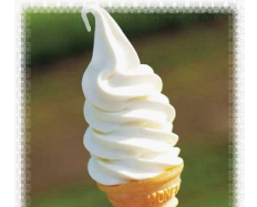
ソフトクリーム (バニラ・抹茶・ミックス) 400円