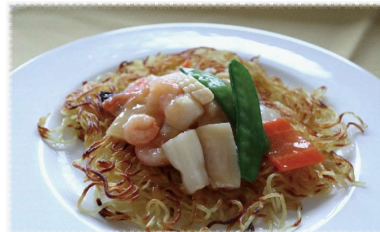
あんかけ焼きそば (わかめスープ付) 1,200円