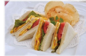
たまごと野菜のサンドウィッチ 1,000円