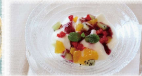
フルーツ杏仁豆腐 500円