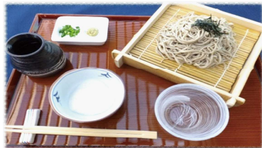
とろろそば/うどん (冷) 900円