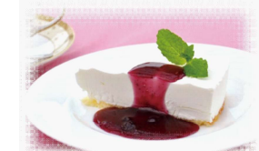
レアチーズケーキ 700円