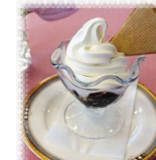
コーヒーゼリーソフト 600円