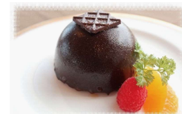
チョコレートムースケーキ 700円