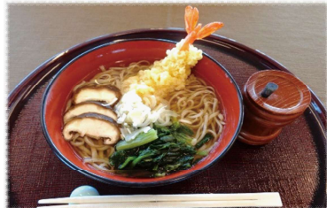
天ぷらそば/うどん (温) 1,200円