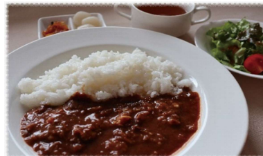
ハヤシライス (スープ・サラダ付) 1,100円