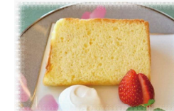
シフォンケーキ 500円