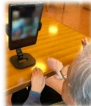
オンライン面会のご様子

上記条件に合わないご面会を希望される場合は病棟にご相談ください。また、直接のご面会以外にもLINEやFaceTimeによるオンラインでの面会を承っております。初回は機器の設定が必要となりますので、新規お申し込みの場合は希望日の前日までにご連絡ください。