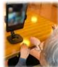
オンライン面会のご様子

上記条件に合わないご面会を希望される場合は病棟にご相談ください。また、直接のご面会以外にもLINEやFaceTimeによるオンラインでの面会を承っております。初回は機器の設定が必要となりますので、新規お申し込みの場合は希望日の前日までにご連絡ください。